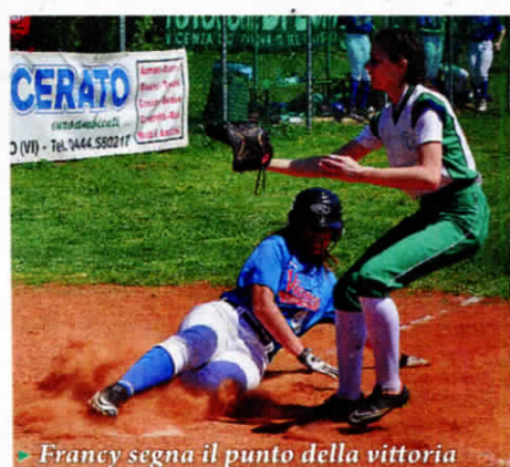
Francy segna il punto della vittoria

che finisce bene, ma la consistenza della squadra la vedremo sabato contro le Thunders di Castelfranco Veneto.