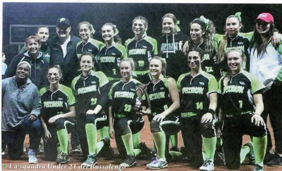
► La squadra Under 21 del Bussolengo

Rinviato a sabato l'atto conclusivo per lo scudetto del softball