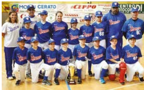
La squadra under 12 indoor